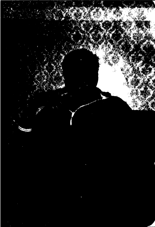
، وأسى لفرانك الشام عام ١٩٨٩